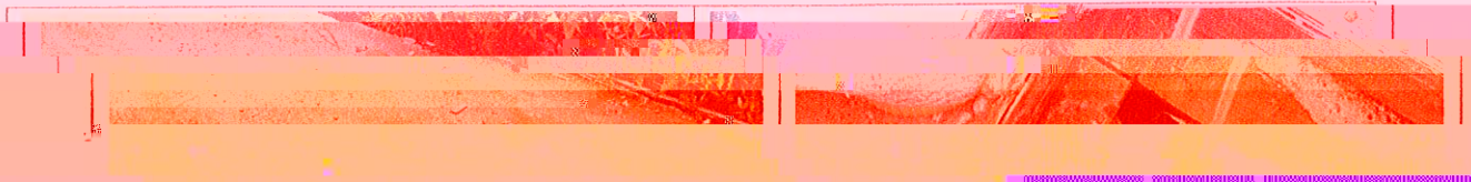
图 1 环封固示意图