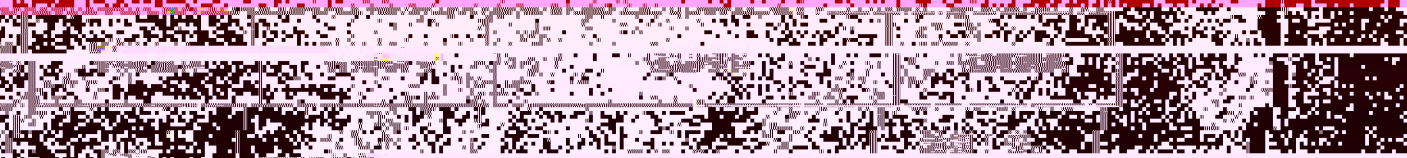
表 3 检测人员和时间