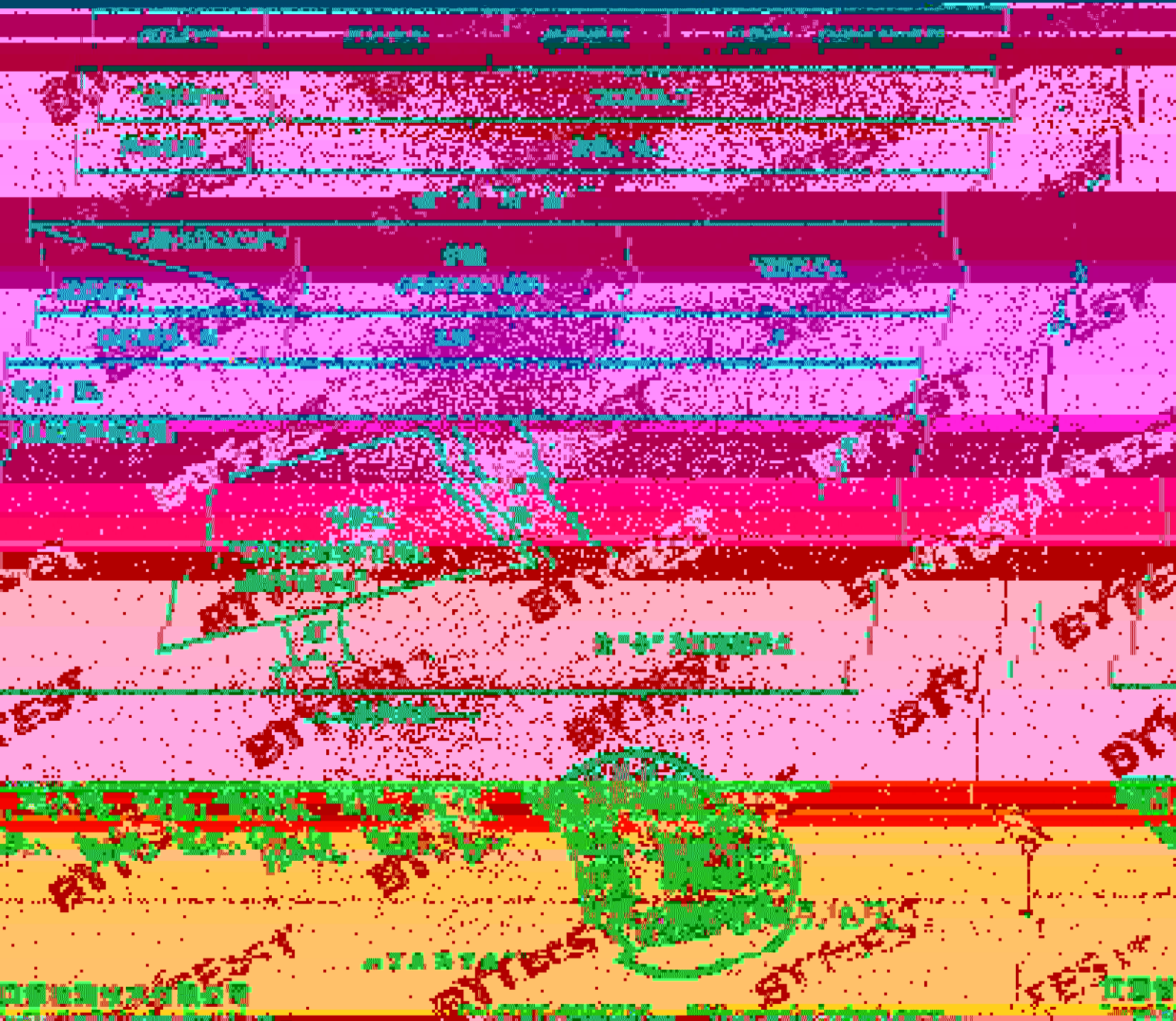
附件 1 固体废物检测报告